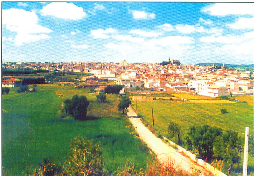
La vila de Santa Margalida vista des de sa Capella i Son Niu