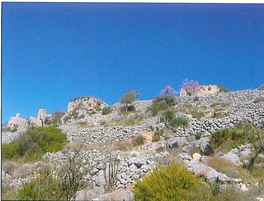
Sa Caseta des Moros (Tàrbena)