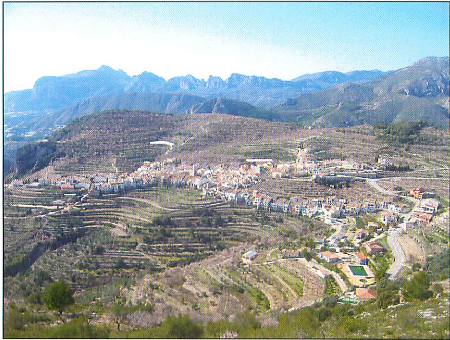
Tàrbena vista des de sa Caseta des Moros