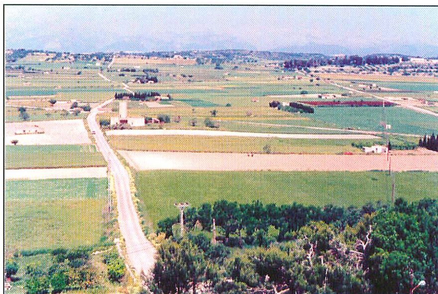
Les Sorts de Santa Margalida, vistes des del Mirador de l'Església