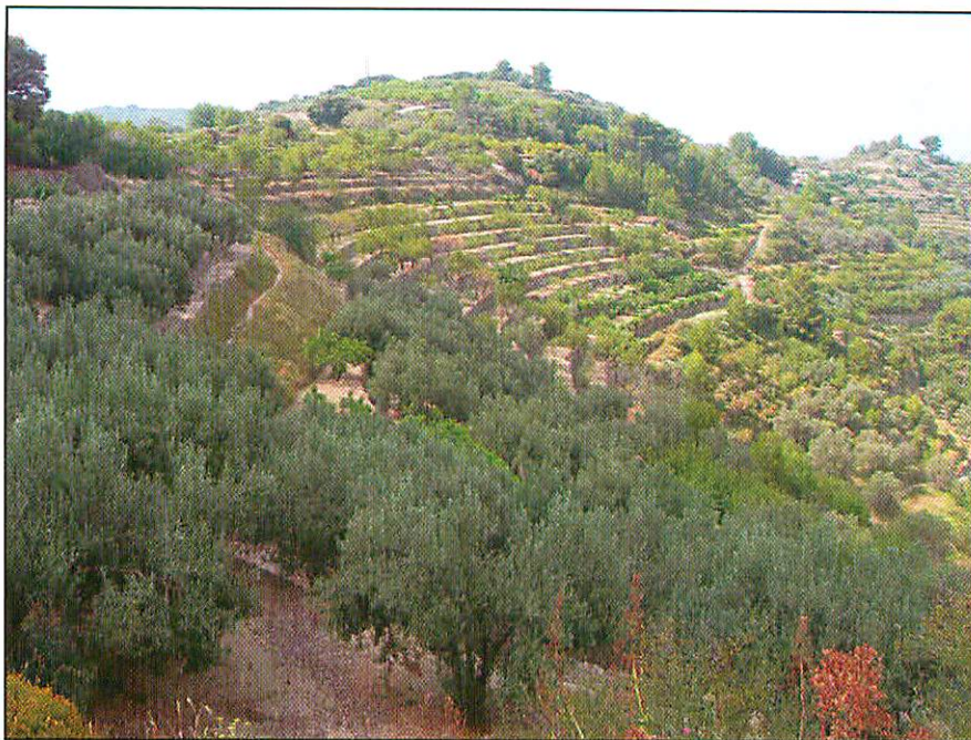
Es tossalet d'en Micalet Monjo (Tàrbena)