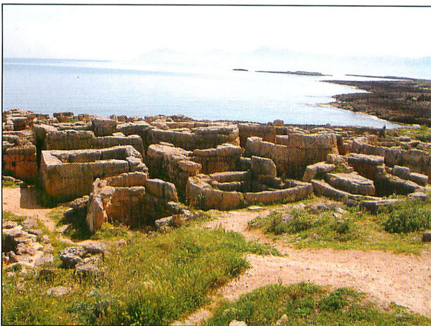
Necròpolis de Son Real (Santa Margalida)